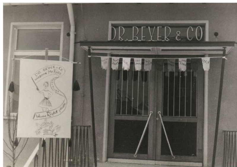
Haupteingang zur Handschuhfabrik in der Fürther Strasse

Auszug aus dem Katalog Nr. 1 „extra chic“