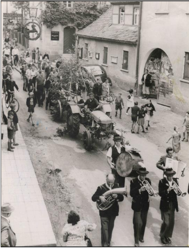
Einholen des Kirchweihbaumes (um das Jahr 1960)